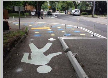
Arriba: topo Segundo de Arriba a Abajo: banqueta temporal Tercero de Arriba a Abajo: mini glorieta Abajo: carril peatonal

Para inscribirse en la lista de correo de actualización del proyecto, envíe un correo electrónico a